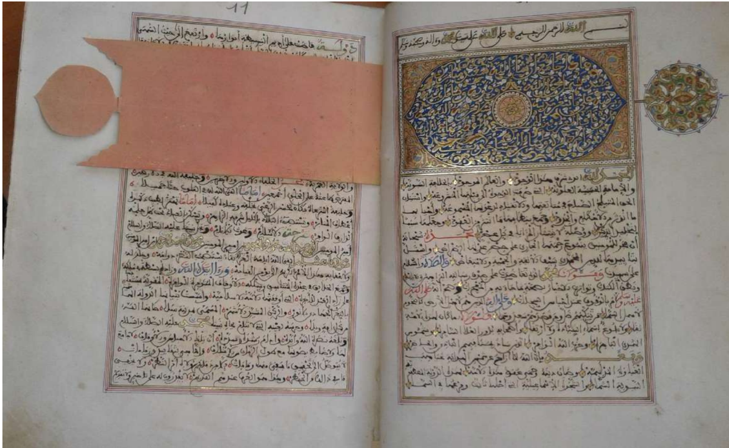
-تقييد أحباس مدينة سلا-